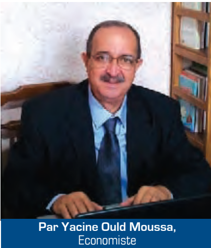
Par Yacine Ould Moussa, Economiste

C' est certes là un objectif bien ambitieux et généreux mais si nous voulons que les bienfaits du développement et de l'émancipation économique et sociale irriguent nos régions et nos wilayas, le principe n'est pas à discuter. Par contre, les modalités de mise en oeuvre suscitent de nombreuses problématiques et appellent des réflexions plurielles et pluridisciplinaires qu'il convient de mener avec le logiciel des trois «D» soit «DIAGNOSTIC, DIALOGUE, DECISION».