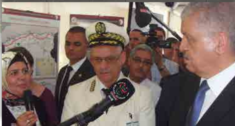
VISITE DE TRAVAIL DU PREMIER MINISTRE À TIARET

Le Ministre de l'Industrie et des Mines en visite de travail dans de nombreuses wilayas du pays