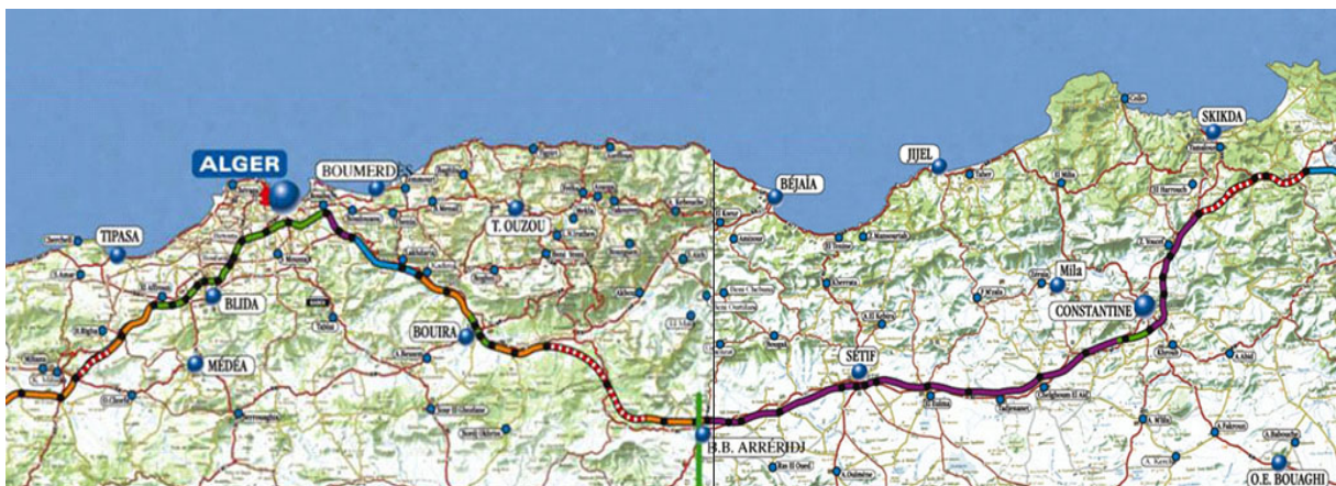
Carte du réseau de l'autoroute Est-ouest de la wilaya